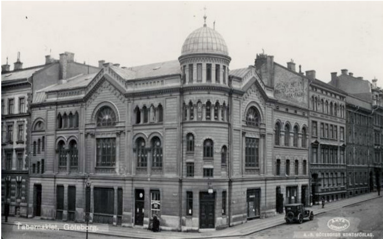
Vykort som visar byggnaderna i hörnet Storgatan/Götabergsgatan med Tabernaklet i förgrunden.